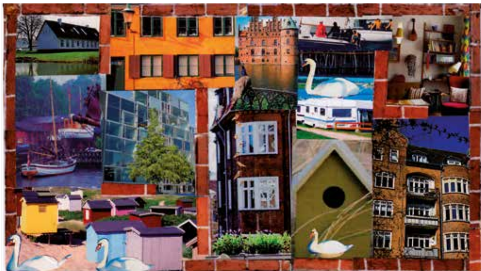
Collage af Ellen Georg.