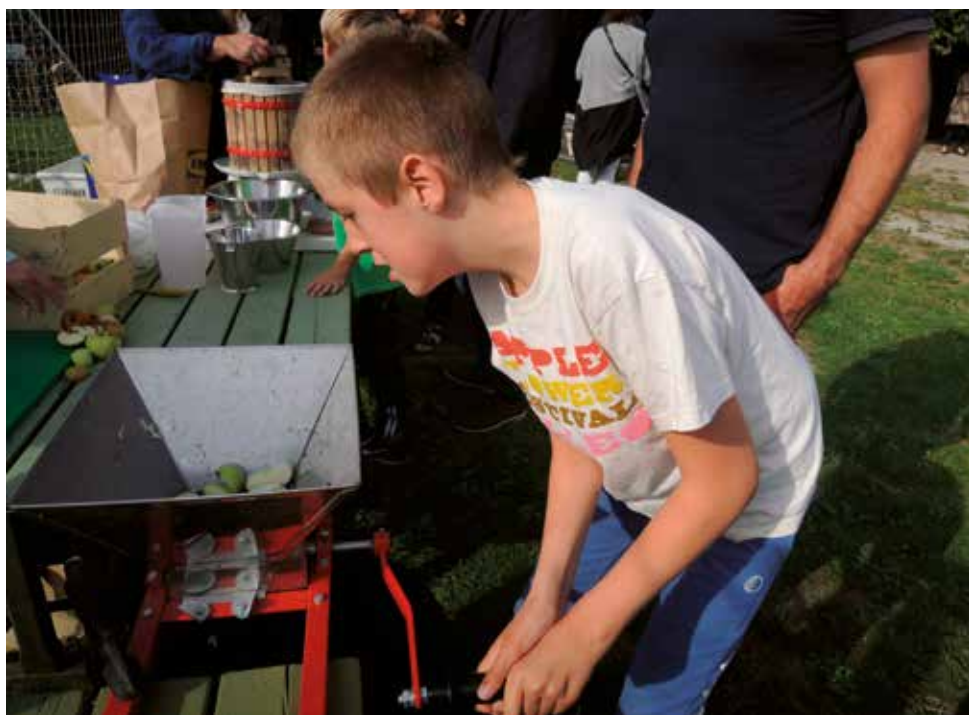
Æblernes kværnes før de presses.

Vi har mange sjove fag, der er nok at lære Nogle har matematik, nogle bager kager Andre går udenfor og laver bål Mens ilden knitrer, får vi popkorn i skål