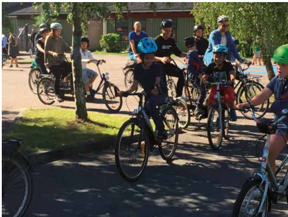
Start på cykleturen