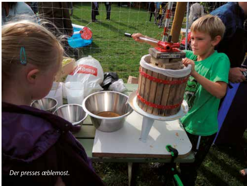
Der presses æblemost.