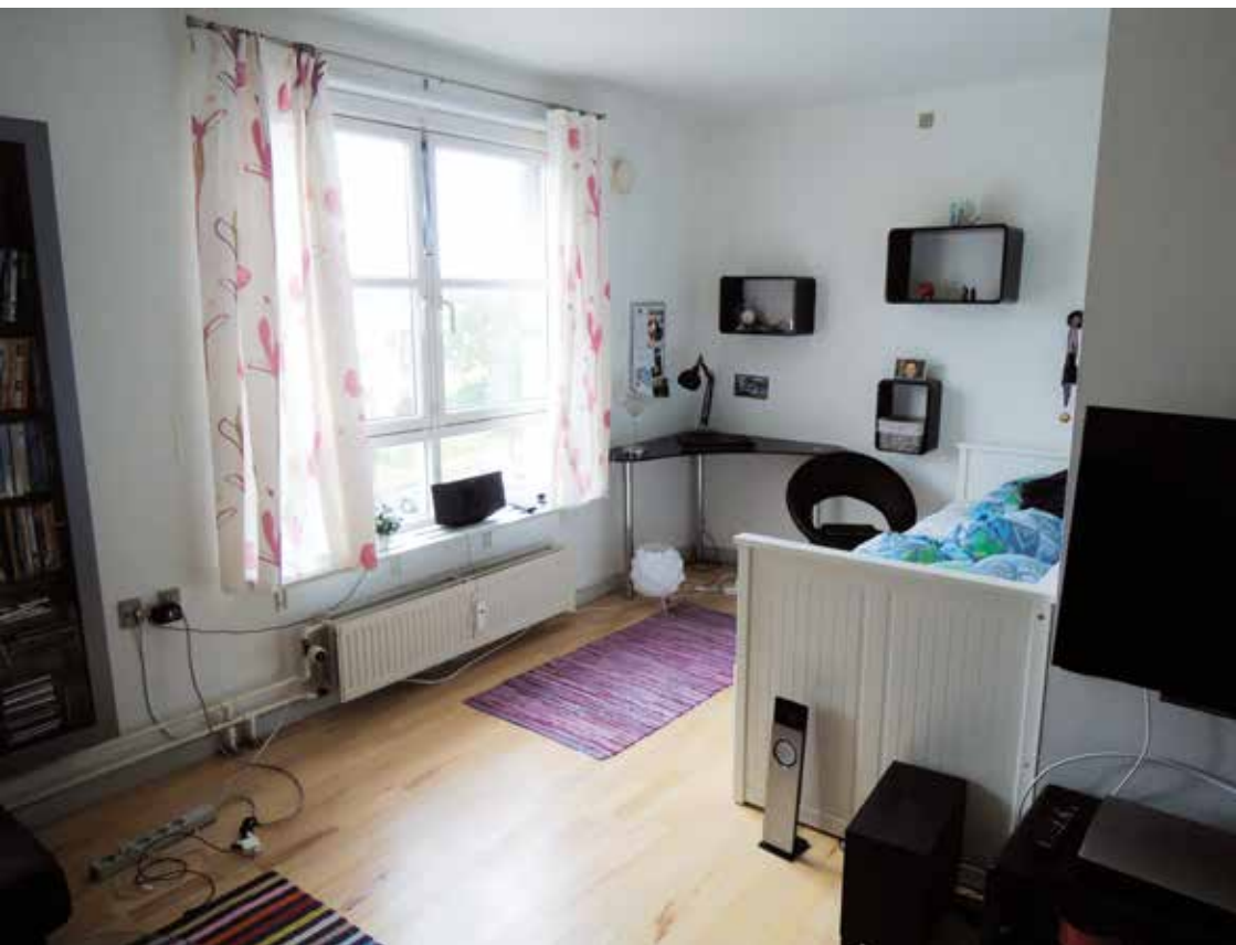
Fra en lejlighed