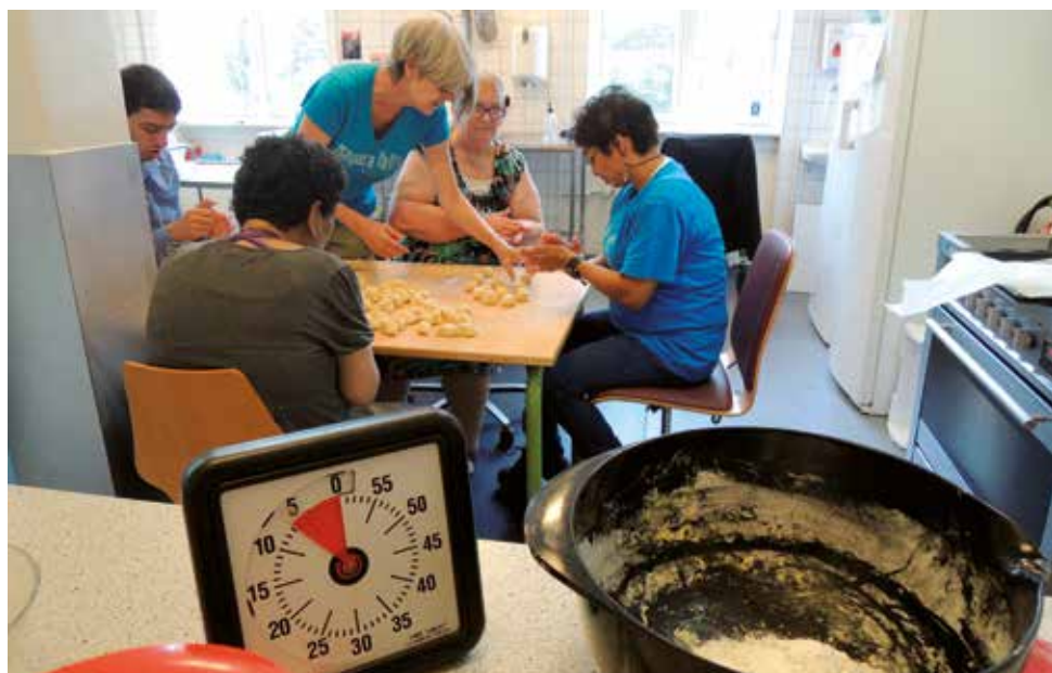
Der bages til fredagens cookie shop