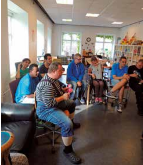
Indtryk fra freddagens kor og musikprøve.

at udvikle nye aktiviteter og samværsformer var begrænsede.