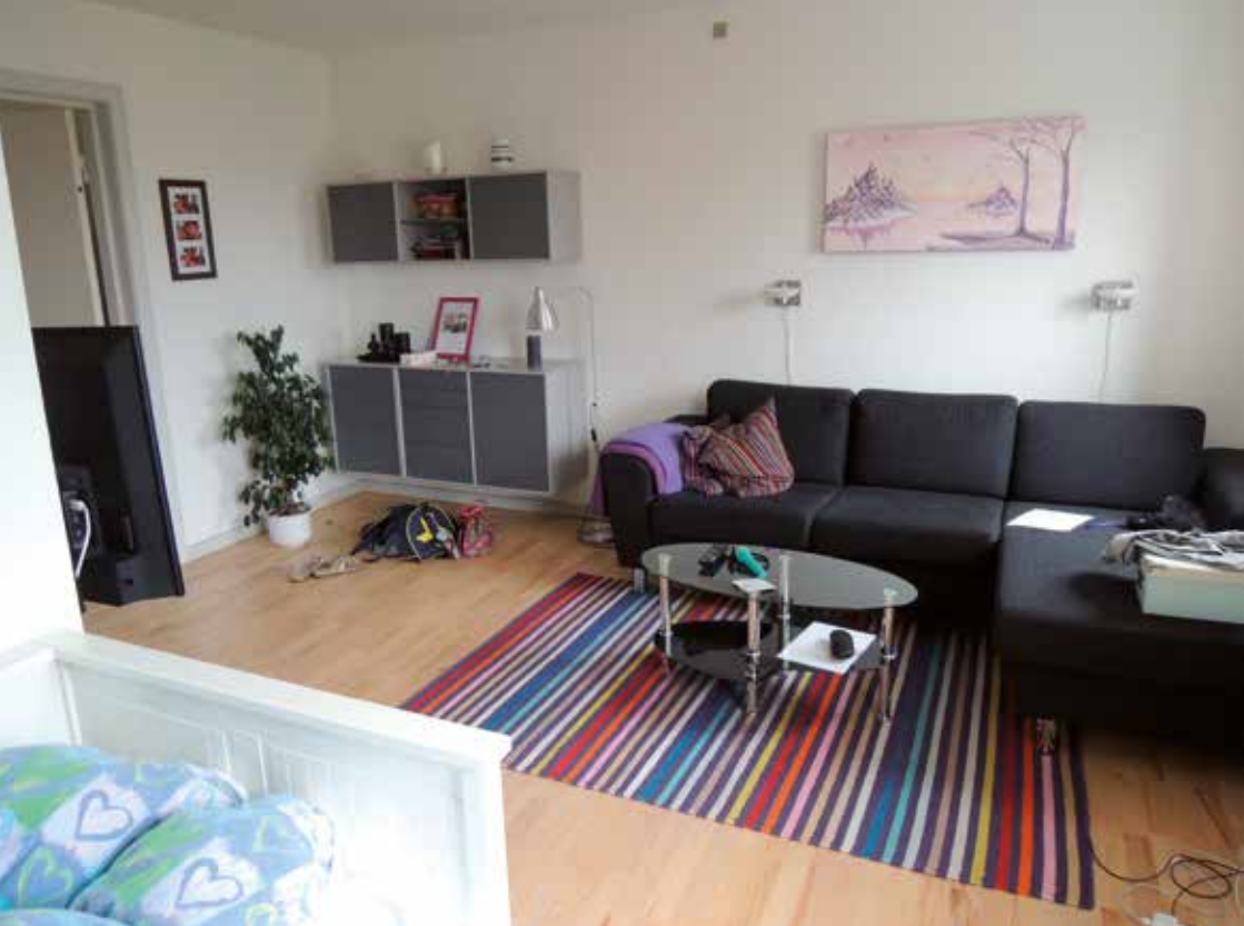
Fra en lejlighed

op gennem trapperummet og passerer etagerne. Stuetagen rummer et stort køkken med spise-/alrum. En hyggelig tæt men rummelig opholdsstue og et kontor, personalets eneste eget rum. Samt et fællestoilet, der også fungerer som mini-vaskeri. Det er det, der signalerer, at det er et botilbud med et fællesareal. På de øvrige etager i opgangen ligger lejlighederne. Jeg får lov til at se en lejlighed, som jeg formoder er typisk for alle de øvrige. En stor rummelig stue med en alkove, en slags 1½ værelses lejlighed, et pænt stort køkken med plads til en lille spiseplads og et velfungerende toilet og badeværelse, der ikke er beregnet til en beboer, der er kørestolsbruger. Hele bofællesskabet forudsætter, at man kan benytte trapper.