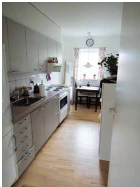
Køkkenet i en lejlighed

Men bostedet forudsætter, at man kan meget selv og er opsøgende – så det er ikke en model for bolig til alle med handicap.