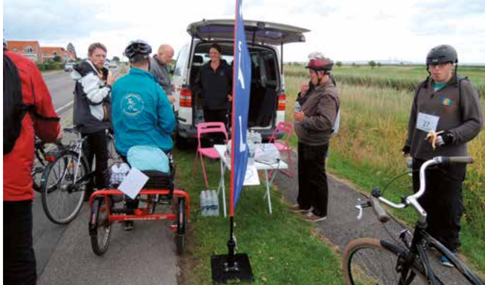
En af depoterne på den 32 km lange rute.

kystvej der indrammer lufthavnen. Herfra ad den gamle Amager Strandvej med sidste depot før man skal helt ned til Øresundvej for at køre på tværs af øen, hvor den er livligst for at nå målet, hvor man startede. Tour de Amager er en opdagelse af, hvor smuk øen er.