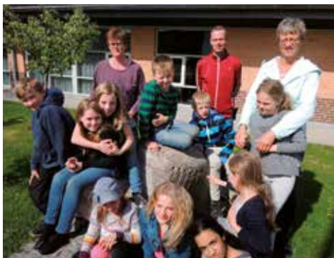
Børn og voksne glade efter et vellykket søskendekursus.

Hvad fik jer til at tage på et søskendekursus, spurgte jeg, og flere fingre røg i vejret end jeg kunne nå at registrere i farten. En