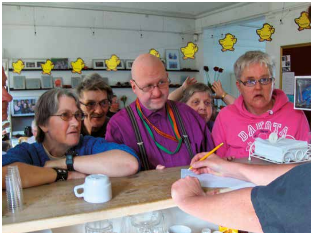
Medlemmer ved disken, et centralt samlingssted i caféen.

eller bevidst, så først ganske kort hvad Café Tusindfryd er: