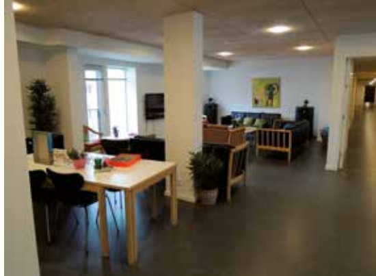
Indtryk af et af bofællesskabets opholdsrum.

sammen, jo bedre, jo mere man færdes rund i de to etager botilbuddet udgør.