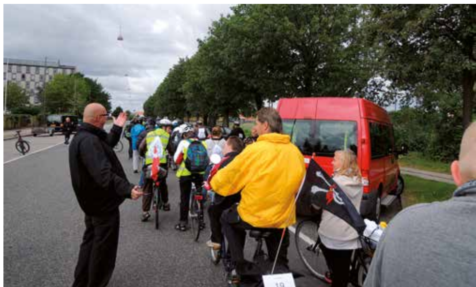
Starten på Tour de Amager.