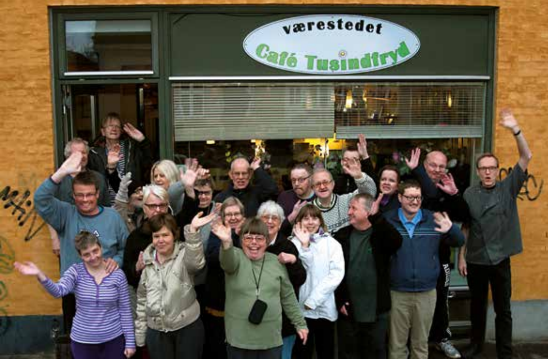
Jubilæumsfoto med medlemmerne foran Café Tusindfryds lokaler på Amagerbrogade.