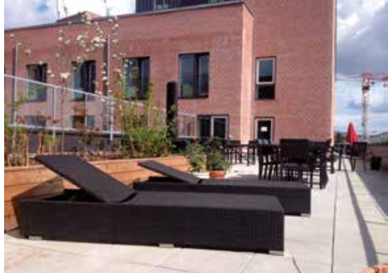
Bofællesskabets to skønne tagterrasser.

af dem er forbundet af en altgang). Det er nogle fantastiske rum, der med bærbuske og frugttræer sat i store højbede giver en fornemmelse af man er til stede på 1. klasse, med liggestole og udekøkkener klar til de gode grillaftener.