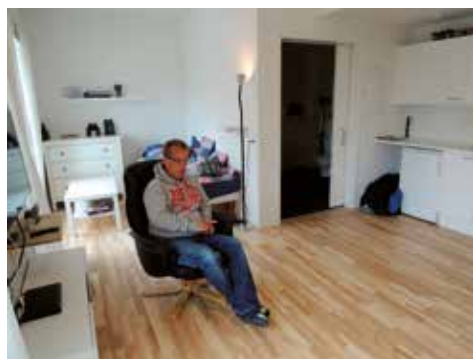
En lejlighed i bofællesskabet.

Ny Ellebjerg ligger op til S-tog stationen af samme navn, midt i et lidt rodet industri-kvarter, hvor der bygges overalt - et kvarter under forandring. I meget af byggeriet gør man sig umage for at skabe afvekslende og personlig udtryk. Ny Ellebjerg er et sådan hus, der selv om det er boliger er inspireret af industriens huse. Et vellykket nyt botilbud.