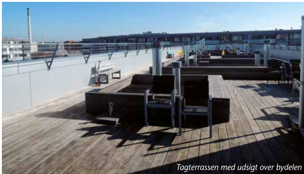
Tagterrassen med udsigt over bydelen