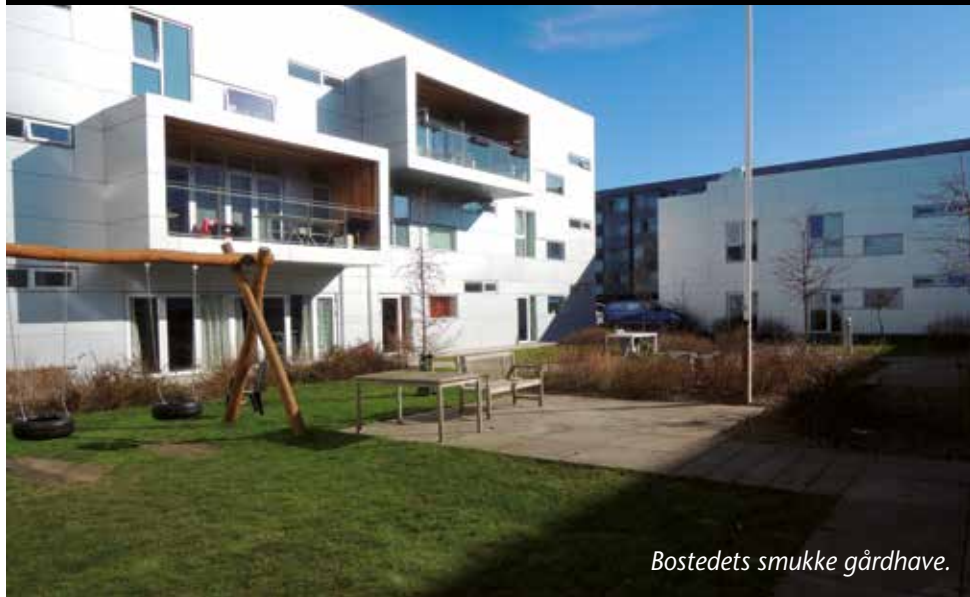
Bostedets smukke gårdhave.