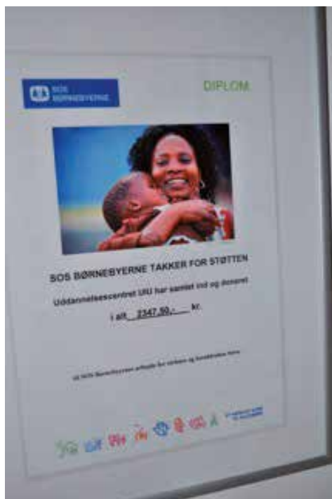
Diplomet fra SOS Byerne.