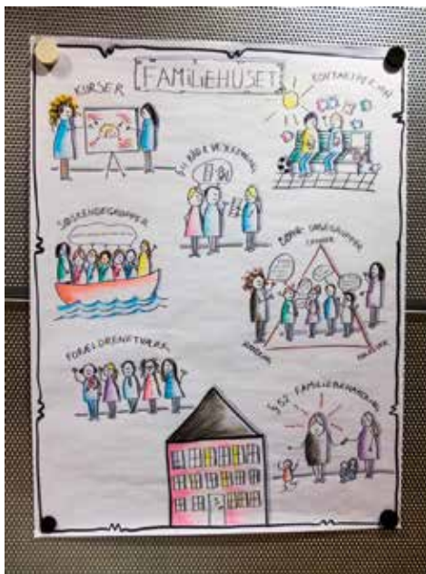
Foredraget som tegning.

Råd- og vejledningsforløb i korte forløb fra 2 gange til 7 gange. Husets familiekonsulent mødes med familien eller familiemedlemmet både hos dem eller i Familiehuset. Rådgivningen kan være at hjælpe med at skabe strukturer i hverdagen for familien,