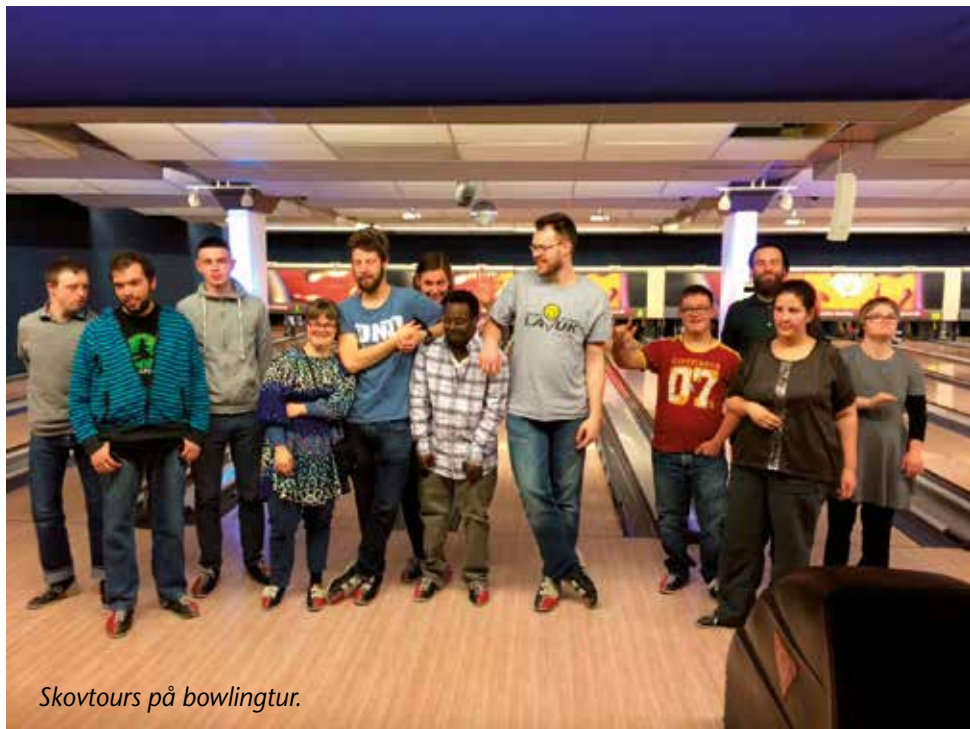
Skovtours på bowlingtur.